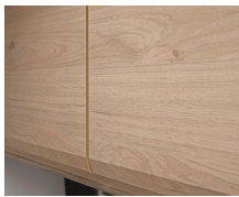
+ Möbeldekor Noce Nagano