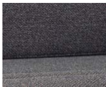
+ Wohnwelt Melia