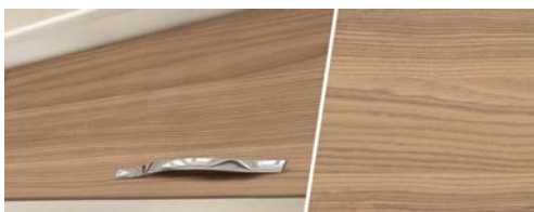
+ Holzdekor Ashton