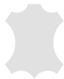
+ Echtleder Individual