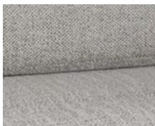
+ Wohnwelt Samir